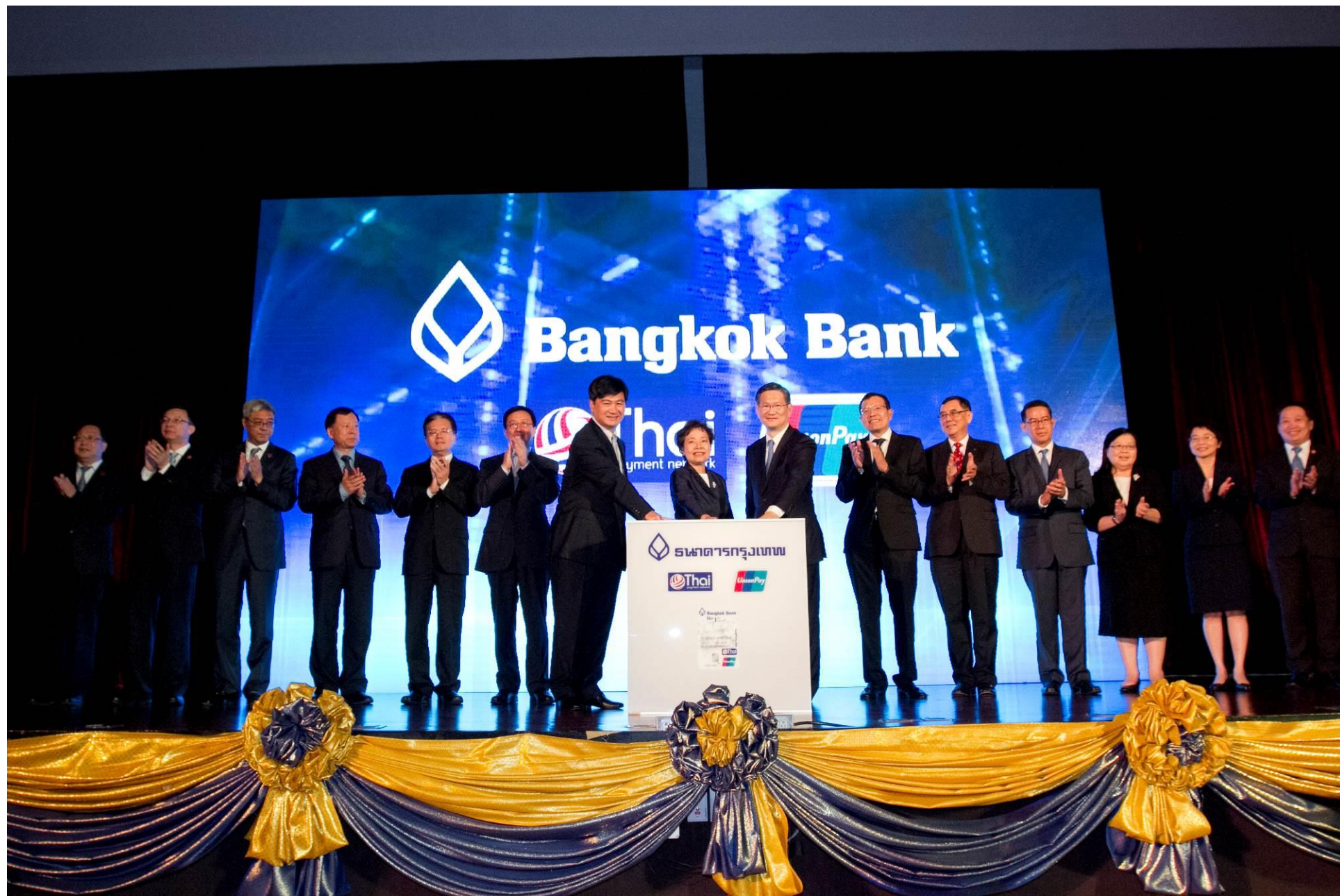
银联TPN借记卡首发仪式