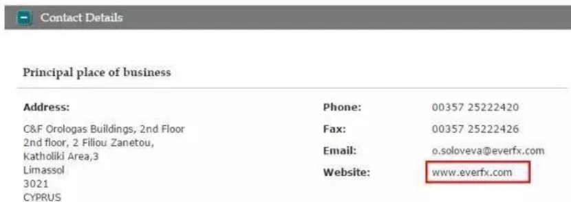
图一 亿鼎国际相关情况截图