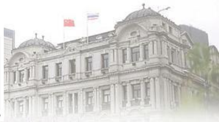
《现行流通硬币磨损标准表》