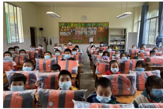
爱心冲锋衣捐赠活动现场