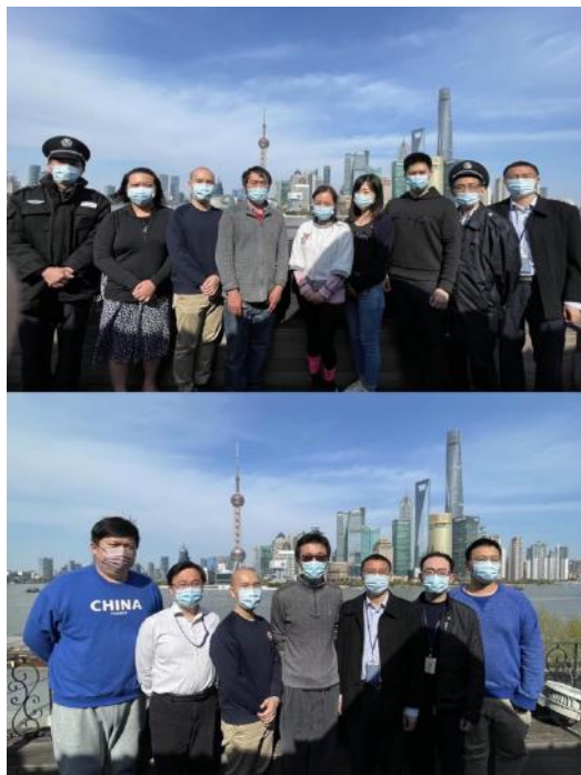
上图：驻守团队部分人员及保安保洁；下图：信息科技部驻守人员

作为一家外资银行，驻守团队中也有来自泰国、马来西亚的同事，他们选择主动留守，携手同心，为抗疫贡献自己的力量。总行信息科技部的同事们承担着盘谷中国全国所有分行的技术支持工作，为了保障上海、北京、深圳、重庆、厦门分行的各项业务平稳连续运行，他们义无反顾，已驻扎在银行半个多月之久，展现了尽忠职守和无私奉献的精神。驻守团队中不仅有这些关键业务岗位的员工，还有辛勤服务的保安、保洁人员，是所有人的默默付出，才有了业务连续的可能。